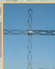
363 rang Séraphine