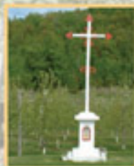
1130 La Petite Caroline