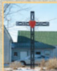
141 rang Saint-Ours