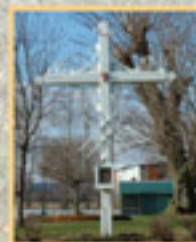
1090 rang Elmire